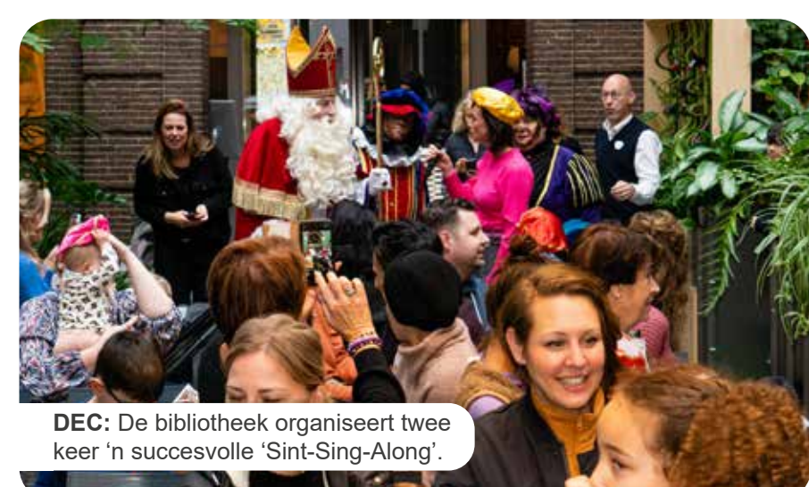
DEC: De bibliotheek organiseert twee keer 'n succesvolle 'Sint-Sing-Along'.