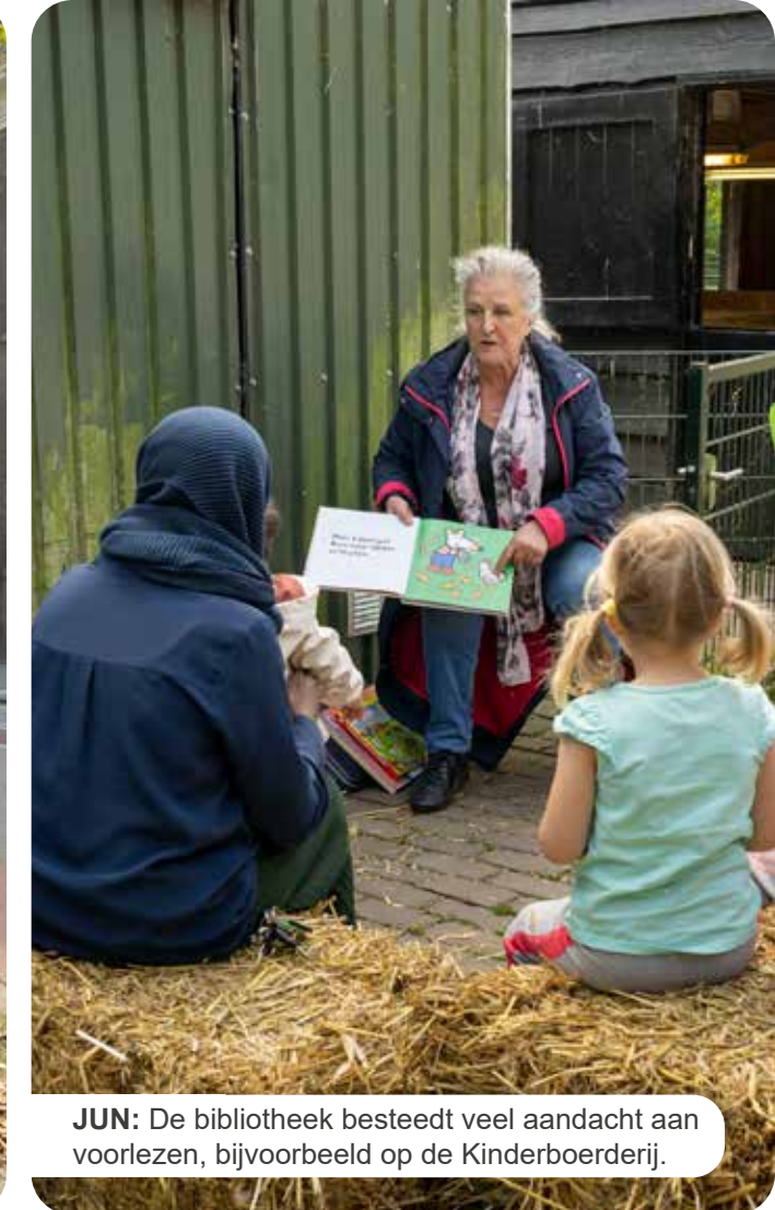
JUN: De bibliotheek besteedt veel aandacht aan voorlezen, bijvoorbeeld op de Kinderboerderij.