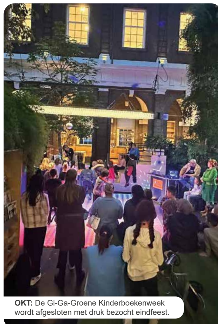
OKT: De Gi-Ga-Groene Kinderboekenweek wordt afgesloten met druk bezocht eindfeest.