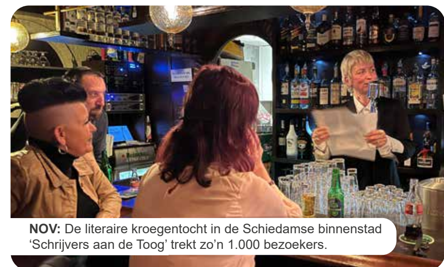
NOV: De literaire kroegentocht in de Schiedamse binnenstad 'Schrijvers aan de Toog' trekt zo'n 1.000 bezoekers.