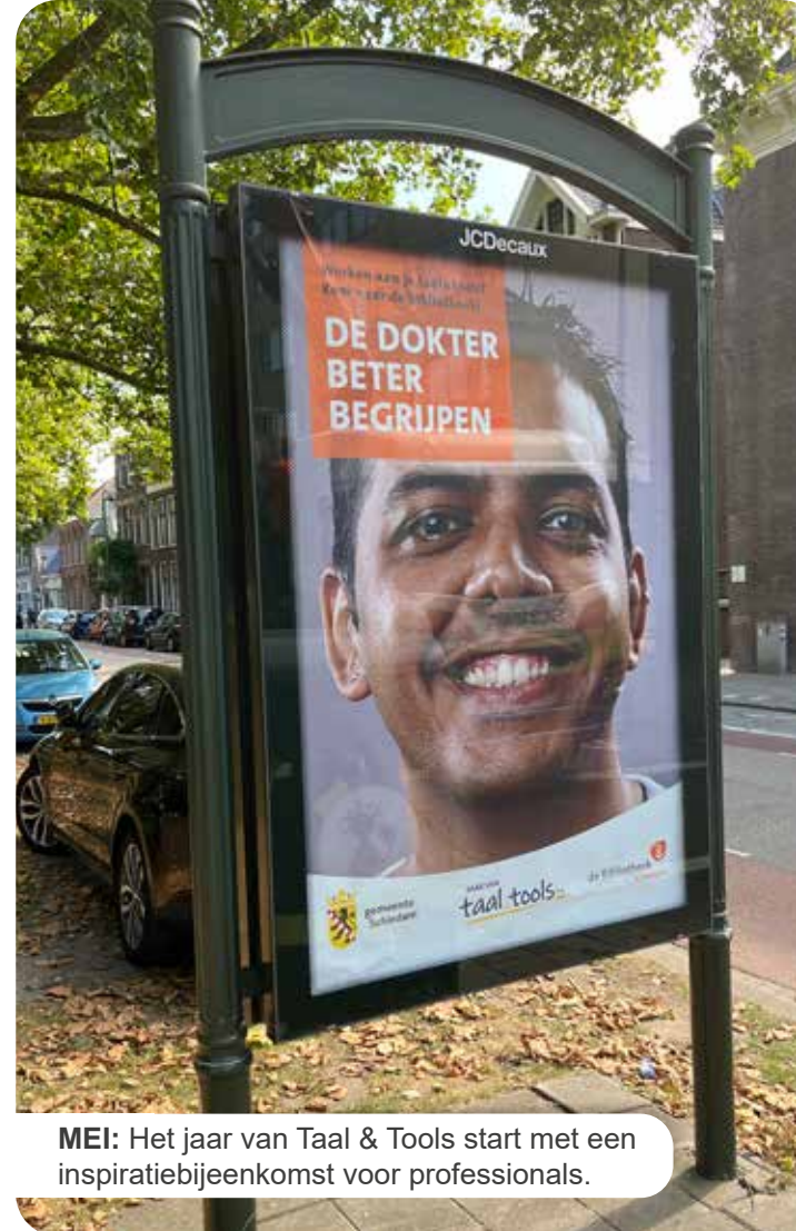
MEI: Het jaar van Taal & Tools start met een inspiratiebijeenkomst voor professionals.