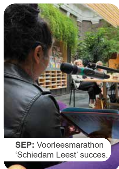
SEP: Voorleesmarathon 'Schiedam Leest' succes.