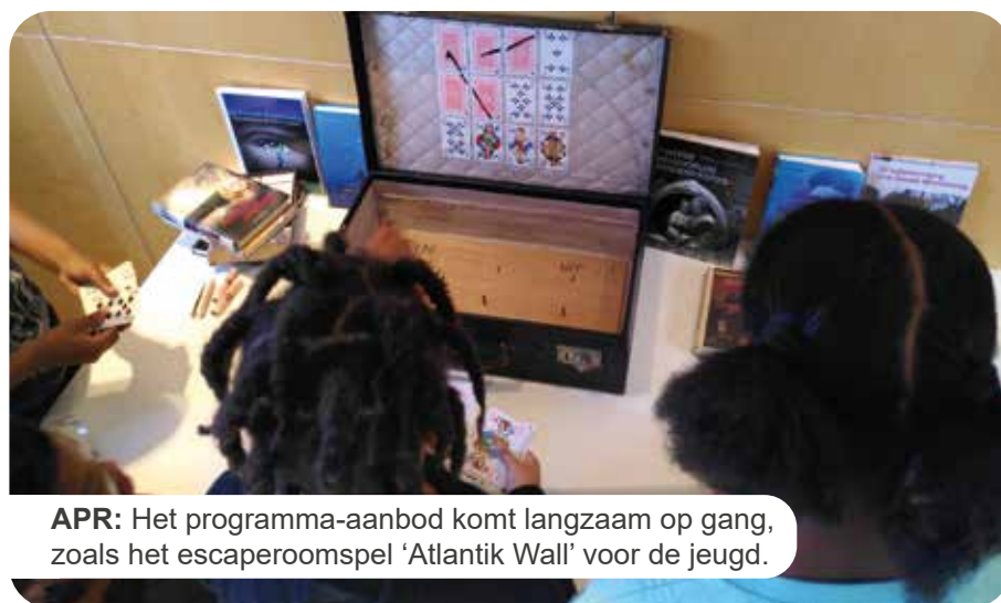
APR: Het programma-aanbod komt langzaam op gang, zoals het escaperoomspel 'Atlantik Wall' voor de jeugd.