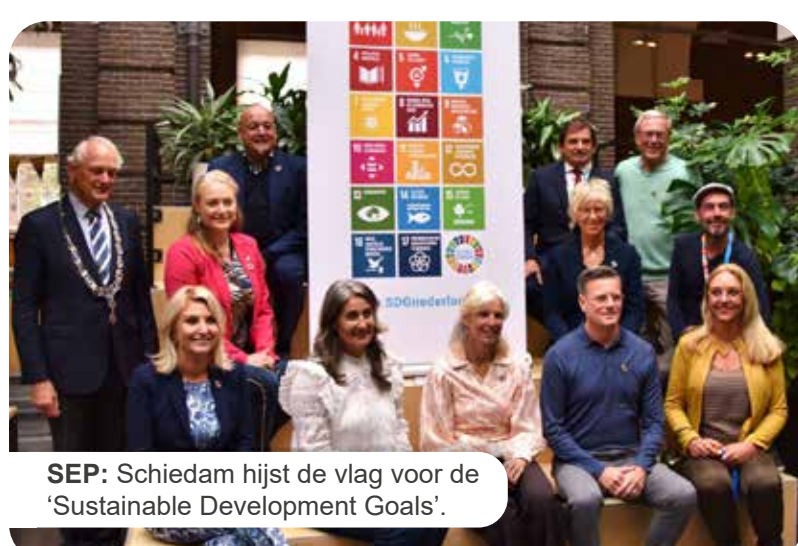
SEP: Schiedam hijst de vlag voor de 'Sustainable Development Goals'.