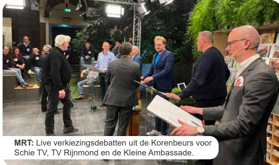
MRT: Live verkiezingsdebatten uit de Korenbeurs voor Schie TV, TV Rijnmond en de Kleine Ambassade.